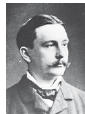
Otto Schott, 1851–1935

Zeiss, Schott et Abbe sont autant de sociétés au prestige international provenant de Iéna. Goethe et Schiller, illustres poètes allemands, y ont également laissé leur trace. Aujourd'hui, de nombreux érudits continuent de converger vers Iéna, car c'est l'endroit idéal pour faire fructifier les grandes idées. En matière de conception de produits à la pointe de la technologie et commercialisables, les habitants d'Iéna ont de l'expérience à revendre. Entrepreneurs et scientifiques le savent bien : question innovations, Iéna est incontournable.