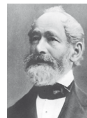
Carl Zeiss, 1816–1888

Les réseaux qui se sont développés à Iéna entre les sciences et l'économie favorisent des cycles d'innovation courts ainsi que la croissance. Quelques exemples : OptoNet e.V. (optique), TowerByte e.G. (commerce en ligne), Präzision aus Jena et medways e.V. (technique médicale).