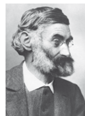
Ernst Abbe, 1840–1905